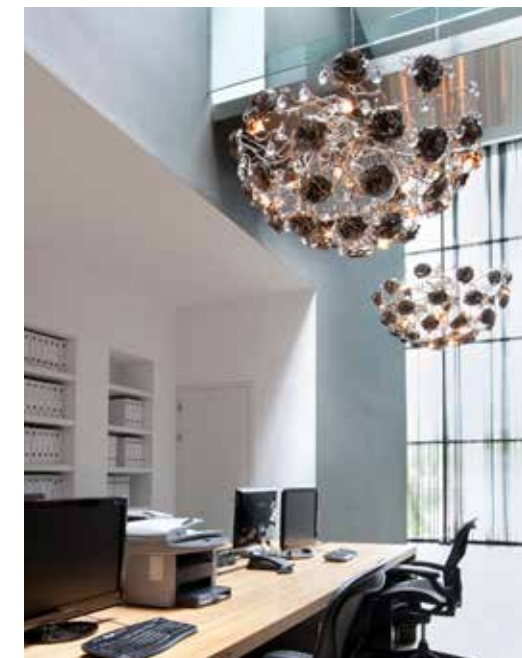
■ Boven: Showroom Brand van Egmond