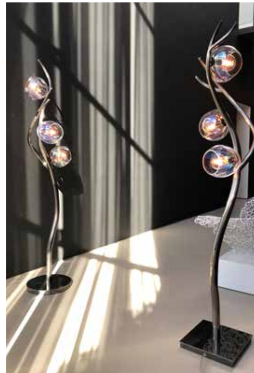
■ Boven: Collectie Ersa

Wie door de showroom van Brand van Egmond loopt, vraag zich wellicht af hoe één persoon deze creaties kan bedenken. Toch is er volgens William een terugkerend thema: georganiseerde chaos. “Je ziet het ook in de natuur. Takken, bladeren, gras... het is chaos in harmonie. Daarom ontwerp ik met mijn handen en niet alleen met mijn hoofd. Dingen moeten groeien en ontstaan en met chaos roep ik een spanningsveld op. Zonder chaos vind ik het vaak een beetje saai”, vertelt hij met een glimlach.