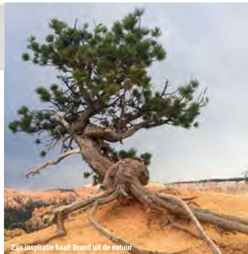
Zijn inspiratie haalt Brand uit de natuur

We nemen afscheid, staan bij de deur die de verduisterde binnenwereld scheidt van het daglicht. Als hij een bepaald licht zou moeten kiezen, als het om schoonheid gaat, wat zou dat